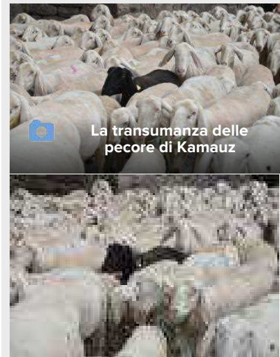
La transumanza delle pecore di Kamauz