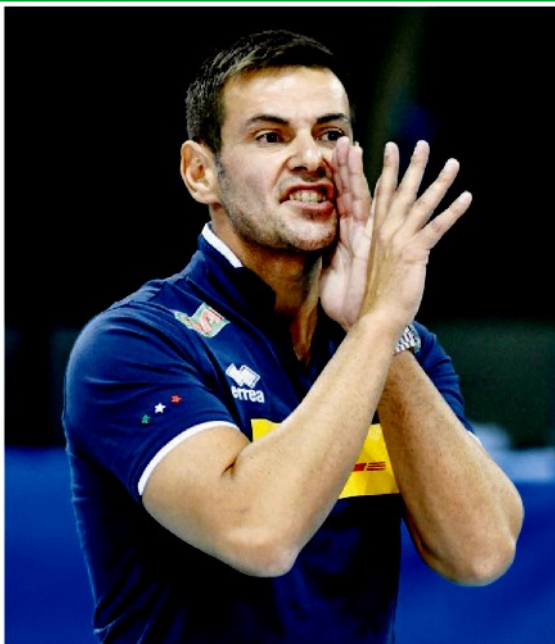
Il ct azzurro Gianlorenzo Blengini, 47 anni